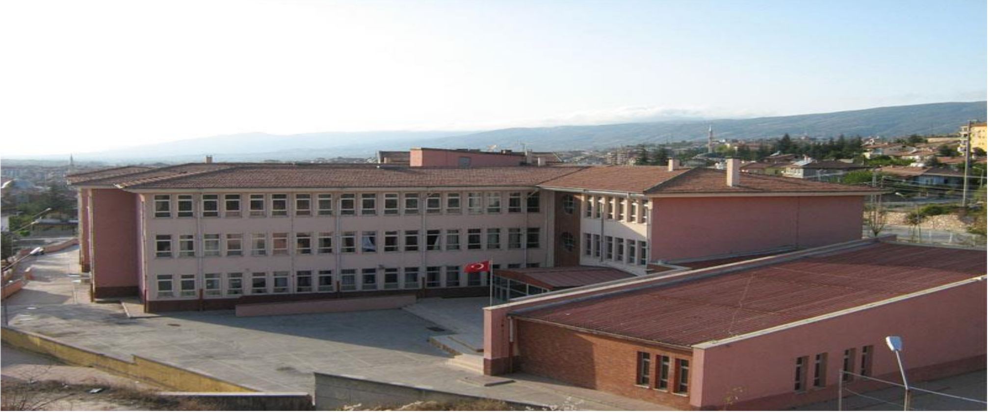
ATATÜRK ORTAOKULU 2019-2023 STRATEJİK PLANI